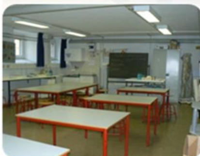
Laboratorio di scienze