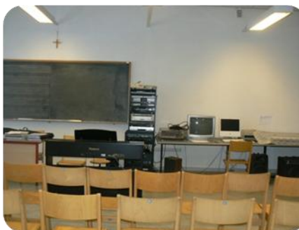
Aula musica corso F