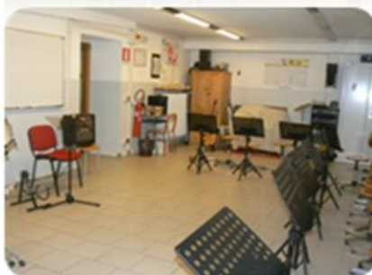
Aula di musica