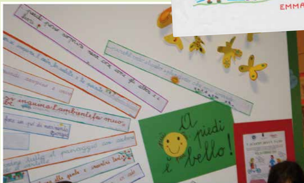
Alunni classe IIA Scuola Primaria di Mattarello