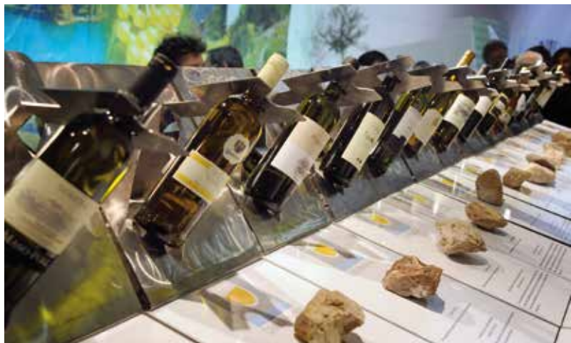
Archivio Foto APT Trento, Monte Bondone, Valle dei Laghi – M. Renzi

Dalla “val del vent” un autoctono trentino: la Nosiola , a cura dell'Associazione dei Vignaioli del Vino Santo Trentino