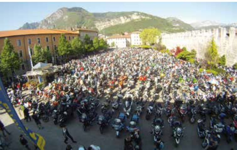
Benedizione delle moto in piazza Fiera

Per informazioni sul programma completo di DiVinNosiola: Azienda per il turismo Trento, Monte Bondone, Valle dei Laghi - www.discovertrento.it