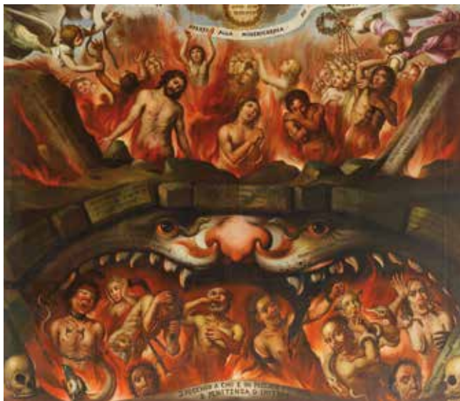
Pittore veneto, Madonna e santi intercedono presso la Trinità per le anime del Purgatorio (particolare), terzo quarto XVII secolo